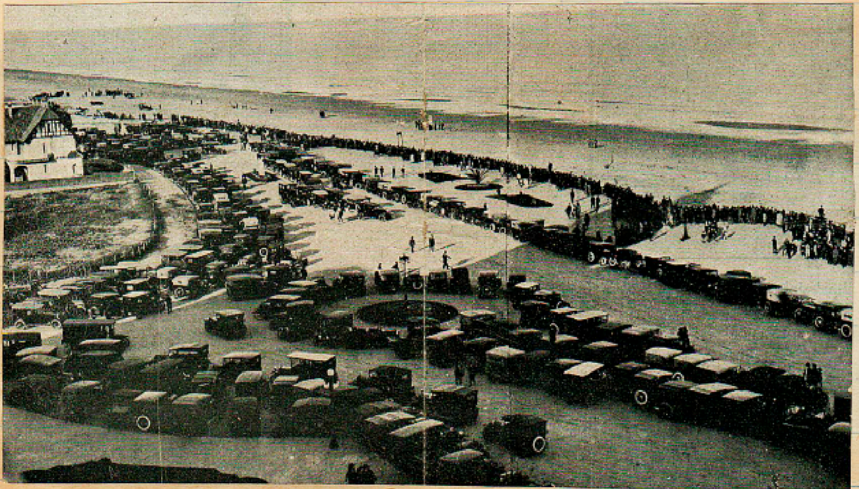
Aspecto de la Playa Carracer el día de la carrera