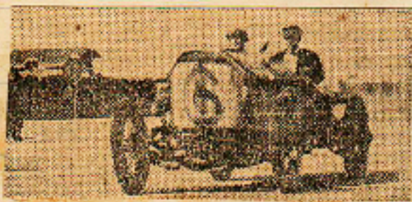
El Daimler Frascchini de Trimaldi 3º en la categoría fuerza libre - 35 2/5 101 K. 694 mts p. h.